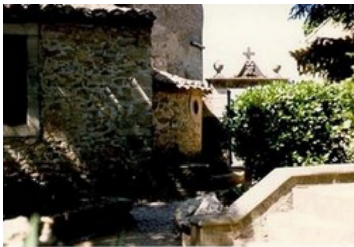
La Sacristie et l'alcôve

De nouvelles ouvertures sont aussi creusées pour les vitraux. La sacristie se voit aussi agrémenter de meubles et de placards dont l'un cache un passage secret permettant de se rendre sans être vu dans la petite alcôve attenante seulement éclairée par une lucarne ronde.