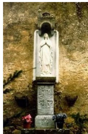
Pilier supportant Notre-Dame de Lourdes

En 1891 s'installe au presbytère la famille Dénarnaud avec laquelle l'abbé Saunière fait désormais fonds communs. En juin, le curé fait disposer dans le jardin, face à l'entrée de l'église, le pilier carolingien sculpté provenant de l'ancien autel. Volontairement placé à l'envers par le prêtre qui a fait graver les mots Pénitence Pénitence et Mission 1891 , le pilier sert de socle à une statue de Notre-Dame de Lourdes. L'ensemble est inauguré le 21 juin 1891 devant les villageois rassemblés et en présence de nombreux invités.