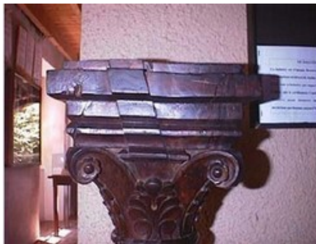
La cachette pratiquée dans le balustre dissimulait un document.