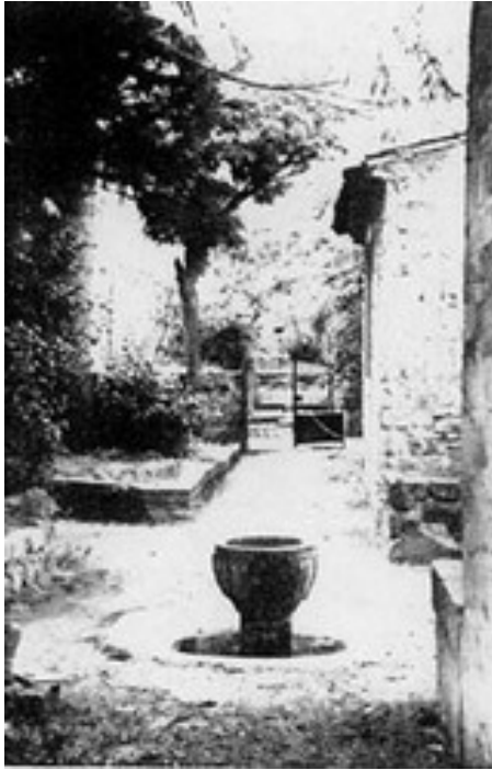
Anciens fonts baptismaux - octobre 1967

En avril 1961, la télévision s'arrête aussi sur la colline le temps du tournage d'un épisode de la célèbre émission de cette époque La roue tourne pour lequel Noël Corbu revêt la soutane. Il fait revivre ainsi l'abbé Saunière au temps où il marchait dans les ruelles du village. Par la petite lucarne et par sa voix, la France entière découvre l'histoire de l'ancien curé mettant au jour le trésor inépuisable de Blanche de Castille.