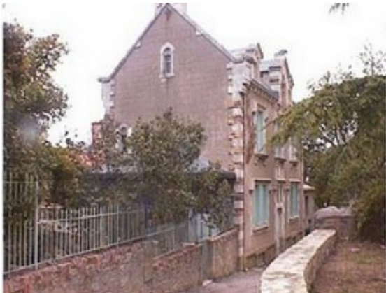
La villa Béthanie

lui, ces derniers remportent le scrutin et le ministre des Cultes assigne alors l'évêque de Carcassonne de sanctionner les prêtres du diocèse qui se sont compromis pendant la période électorale.