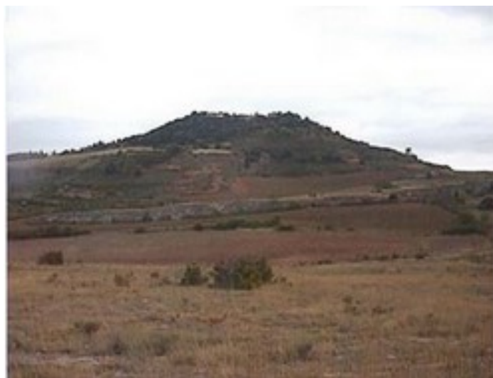
La colline abritant le village de Rennes-le-Château était-elle, par le passé, occupée par une grandiose cité ?

Des trésors, il en existe de nombreux dans ce village. Beaucoup sont régulièrement mis au jour, mais ceux-là sont exclusivement archéologiques : tessons de poteries découverts fortuitement en 1997 dans le jardin de la villa Béthanie, fragments d'un objet en bronze pré-médiéval, d'un pied de vase sigillé, de céramiques gauloises du premier siècle etc. Si ces découvertes précieuses constituent une avancée sérieuse vers une présence humaine continue du site, elles ne prouvent cependant pas matériellement l'hypothèse tant de fois suggérée de l'héritage d'une importante cité wisigothe mentionnée au VIII e Siècle par l'évêque Théodulphe, que les doux rêveurs, dont je suis, se plaisent à nommer Rhedae.