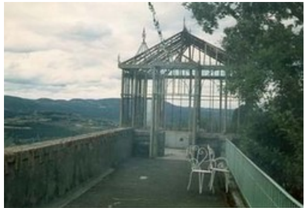
Le jardin d'hiver, pendant de la tour Magdala

L'année 1886 est aussi très importante pour l'un des confrères de Bérenger Saunière, l'abbé Henri Boudet qui officie dans le village voisin de Rennes-les-Bains. Ce dernier publie à compte d'auteur un ouvrage intitulé La Vraie Langue Celtique et le Cromleck de Rennes-les-Bains . Il s'agit d'une étude linguistique où l'auteur tente de démontrer que toutes les langues, dialectes, idiomes parlés aujourd'hui dans le monde tirent leur origine de l'anglais moderne. A cet effet, Henri Boudet s'appuie sur l'histoire des peuples et décrit curieusement un cromleck... qui n'existe pas à Rennes-les-Bains. Par cet ouvrage, l'auteur est définitivement relégué par la critique spécialisée à une place de brave prêtre du pays . Mais il ne se décourage pas et présente en 1893, à la Société des Arts et des Sciences de Carcassonne , un travail, Remarques sur La phonétique du dialecte languedocien , qui lui vaut des éloges. En revanche, il ne confie à aucune instance Du nom de Narbonne , autre étude réalisée en 1896.