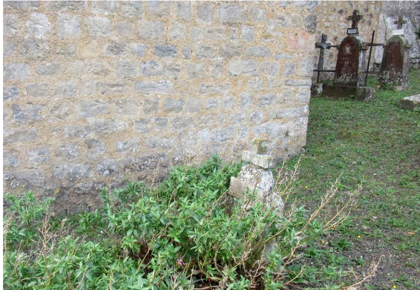
Vue actuelle du mur du clocher

Mais entre la photographie de 1960 et 2000, il est fort probable qu'il y ait eu d'autres travaux qui, eux, auraient effacé, à cet endroit du clocher, les traces laissées par d'éventuels anciens crochets qui servaient, selon certains, à fixer la stèle de la marquise.