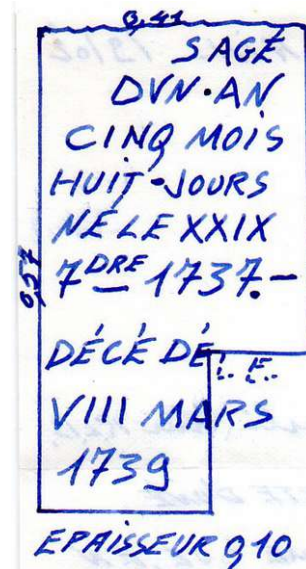
Restes de la pierre tombale du petit Joseph d'Hauptoul ; à droite son relevé par Jacques Biehler

La pierre de sépulture de Joseph d'Hauptoul a été ramenée du cimetière dans les années 1980 par des membres du bureau de l'association Terre de Rhedae pour être exposée au musée de Rennes-le-Château où elle demeure encore.