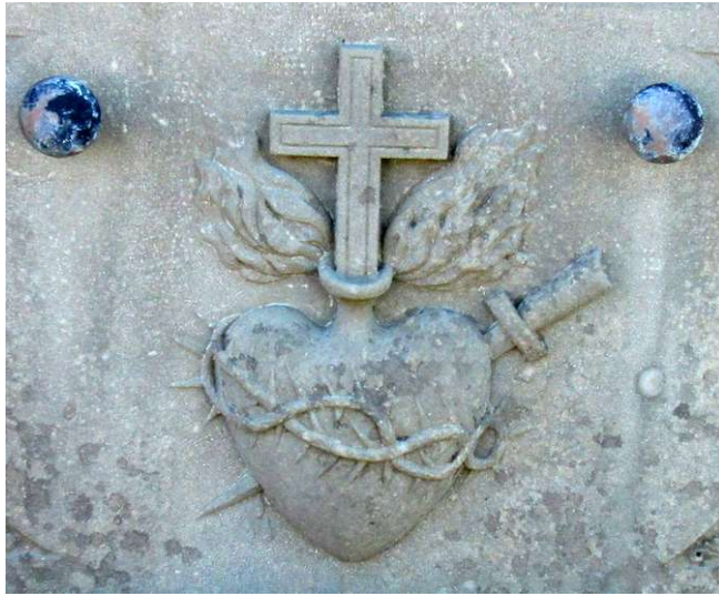
Dans un cimetière proche de Rennes-le-Château

Ne peut-on y discerner l’empreinte d’un Sacré-Coeur de Jésus semblable à celui provenant d’un caveau funéraire sis dans le cimetière de Pauligne ? 2