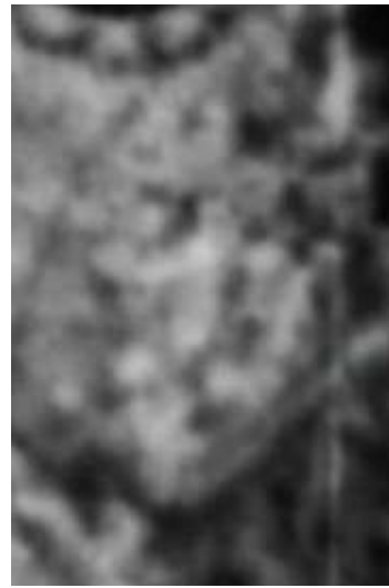
Le bas du clocher en 1952 et la sculpture en détail

À la gauche du Sacré-Cœur, on distingue également ce qui semble être une petite tombe garnie de fleurs ou d'ornements comme il y en a encore aujourd'hui à l'endroit de sépultures 3 , tel l'exemple ci-dessous.