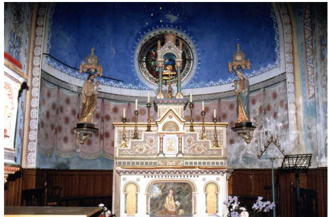
L'intérieur de l'église en 1995

À l'appui de ces clichés, certains ont avancé que cette pièce de décoration avait été probablement acquise et installée par l'abbé Saunière. En premier lieu, d'autres témoignages photographiques contredisent cette hypothèse. Une première vue de l'intérieur de l'église, prise vers 1910, montre l'autel avec aucun objet de ce type à ses côtés.