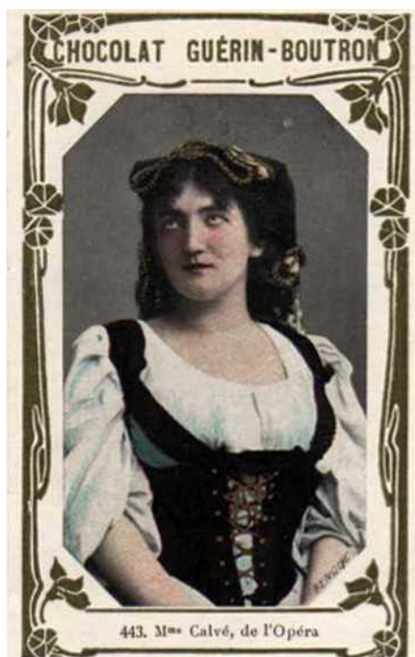
Chromo publicitaire avec rehauts d'or du chocolat Guérin-Boutron