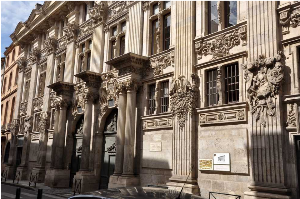
Hôtel Daguin à Toulouse