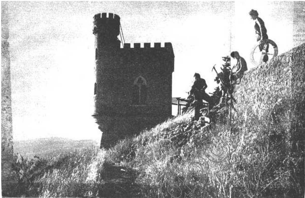
CETTE ANNÉE ENCORE, LES CHERCHEURS ONT TENTÉ DE RETROUVER LE PRODIGIEUX MAGOT ENFOUI À RENNES-LE-CHATEAU PAR L'ABBÉ SAUNIÈRE. Curé d'un minuscule village, il vécut au début du siècle comme un véritable milliardaire.

Cette année encore, les chercheurs ont tenté de retrouver le prodigieux magot enfoui à Rennes-le-Château par l'abbé Saunière, Curé d'un minuscule village ; il vécut au début du siècle comme un véritable milliardaire.