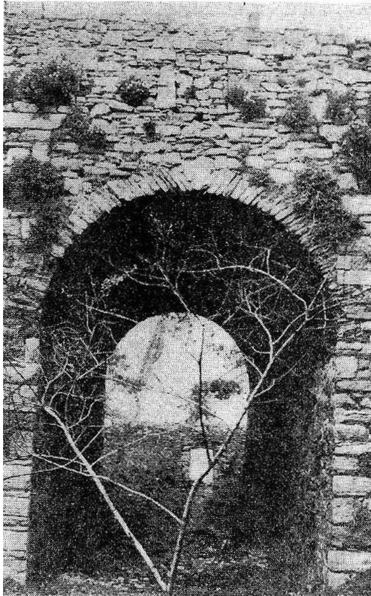
Ce pont, déjà vieux, remplace l'antique pont-levis qui enjam- bait le profond fossé.