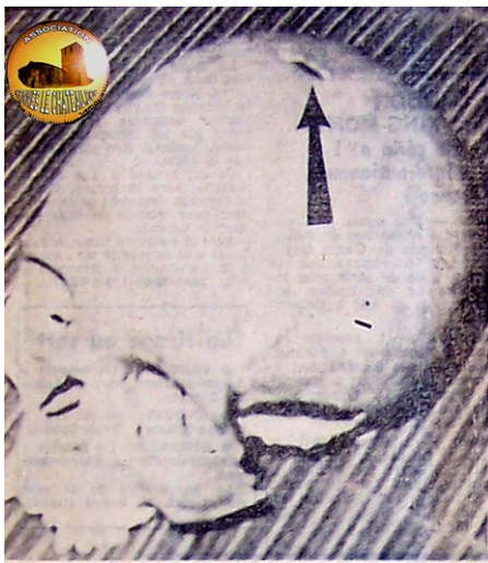
Le crâne de Malacan : une flèche indique la blessure crânienne.

Envoyer vos commentaires à : patrick.mensior@rennes-le-chateau-doc.fr ou directement sur la news