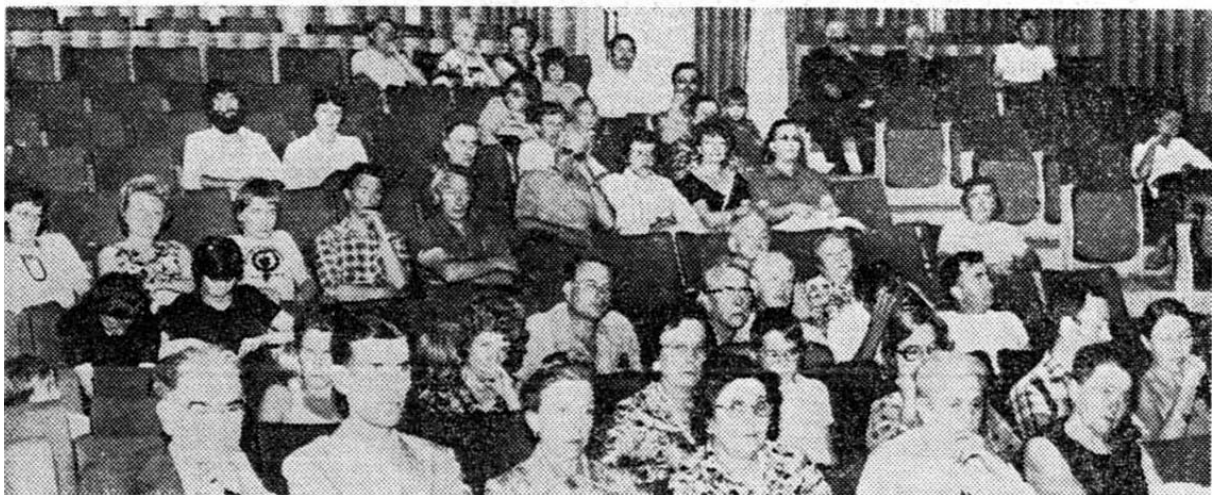
Un public intéressé au débat sur le trésor maudit.